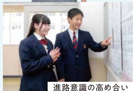
進路意識の高め合い