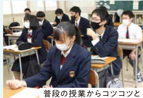
普通の授業からコツコツと